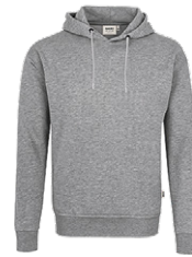
015 grau meliert